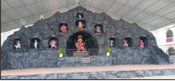
નવદુર્ગા - શ્રી અંબેધામ - ગોધરા-કચ્છ.

આપણી સંસ્કૃતિ માં નારી ને નારાયણીની ઉપમા આપવામાં આવી છે તેથી નારી આપણે ત્યાં “મા” તરીકે પુજાય છે.