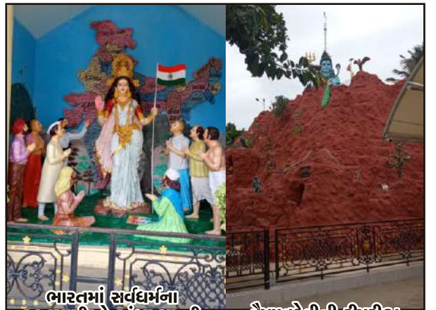
ભારતમાં સર્વધર્મના અનુયાયીઓ અંબા મા ની ઉપાસના કરે છે.

(૧) માં શૈલપુત્રી, (૨) માં બ્રહ્મચારિણી, (૩) ચન્દ્રધંણ્ટા, (૪) કૂષ્માણ્ડા, (૫) સ્કન્દમાતા, (૬) કાત્યાયની માતા, (૭) કાળરાત્રિ, (૮) મહાગૌરી સિદ્ધિદાત્રી, (૯) અંબે માતા. (જેની વિશેષ જાણકારી આવતા અંકે...)